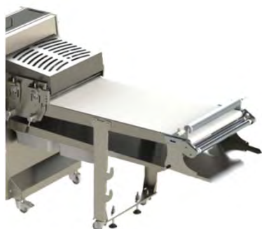
Gamba dx con ruote e porta coltelli, ripiano e bacinelle, avvolgitore Right leg with wheels & knife rack, shelf & basins, reeler