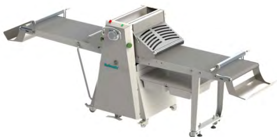
Gamba dx con ruote, ripiano e bacinelle Right leg with wheels, shelf & basins