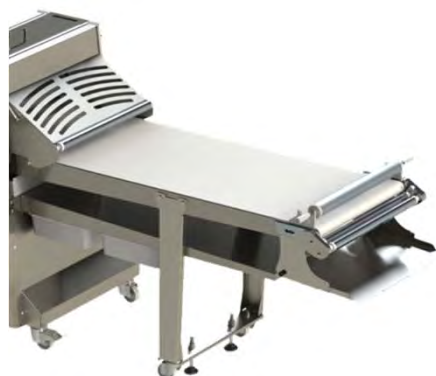
Gamba dx con ruote, ripiano e bacinelle, avvolgitore Right leg with wheels, shelf & basins, reeler