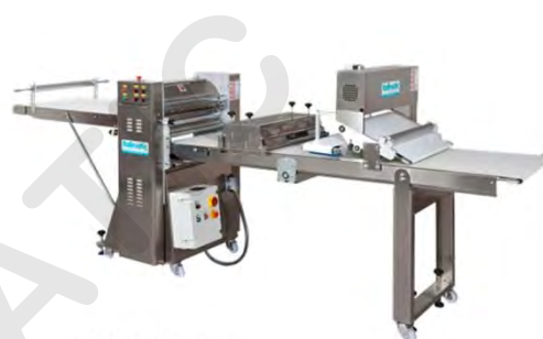
CL660 Pizza line